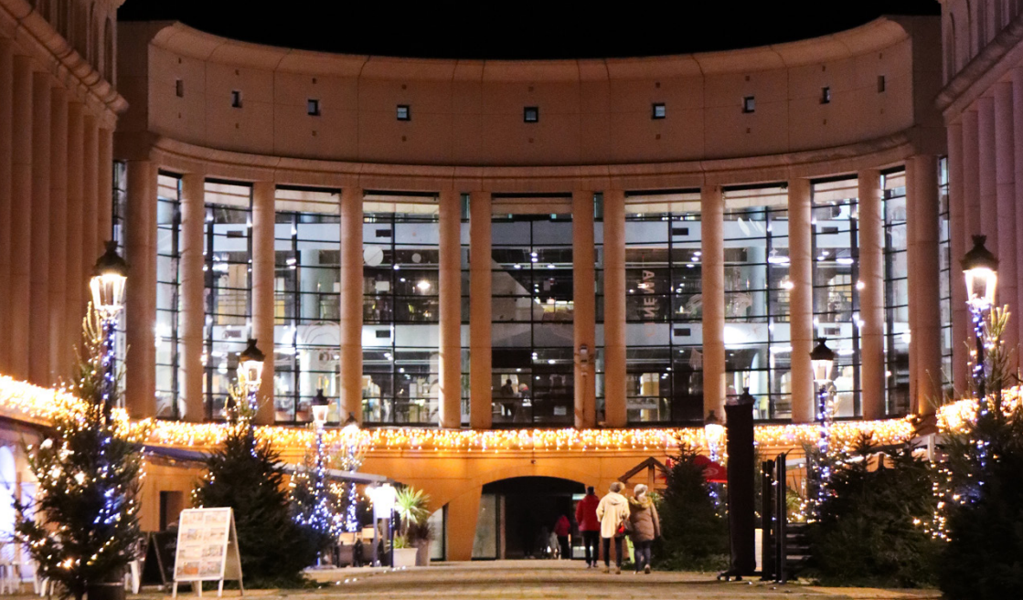
Photo de couverture : Place de l'Europe avec le Dôme Théâtre et la Médiathèque Intercommunale Albertville